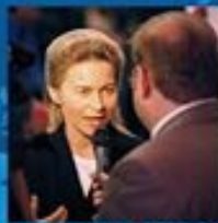
Foto ist von diesem link https://de.wikipedia.org/wiki/Ursula_von_der_Leyen

https://de.wikipedia.org/wiki/Angela_Merkel