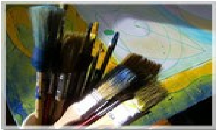
AKTUELR MALKURESE AUCH