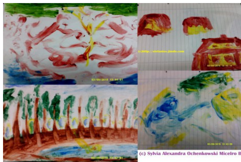
(c) Sylvia Alexandra Ochenkowski Micelro Boakobe

Auch als Geister können viele Wesen sehr hilfreich sein, denn es gibt eine weitere Realität hinter der alltäglichen und sichtbaren Welt. Auch die Wesen aus dem All, aus dem Kosmos sind schon lange auf dieser Erde, manchmal kann man diese sogar sehen, oder irgendwie wahrnehmen. Einige sind hilfreich und interessiert an dem Leben der Menschen, manche anderen können eher hinderlich und gefährlich sein, so wie auch manche Menschen. Doch ich entscheide mich für eine konstruktive Kooperation, mit solchen die auch Umwelt, Natur und die Menschheit gerne haben, sowie meinen Freien Willen respektieren. (c) SAO Micelro Boakobe